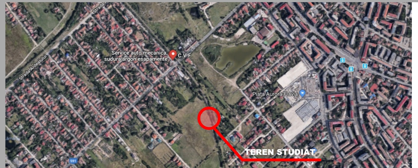
IMAGINE ORTOFOTO - fara scara